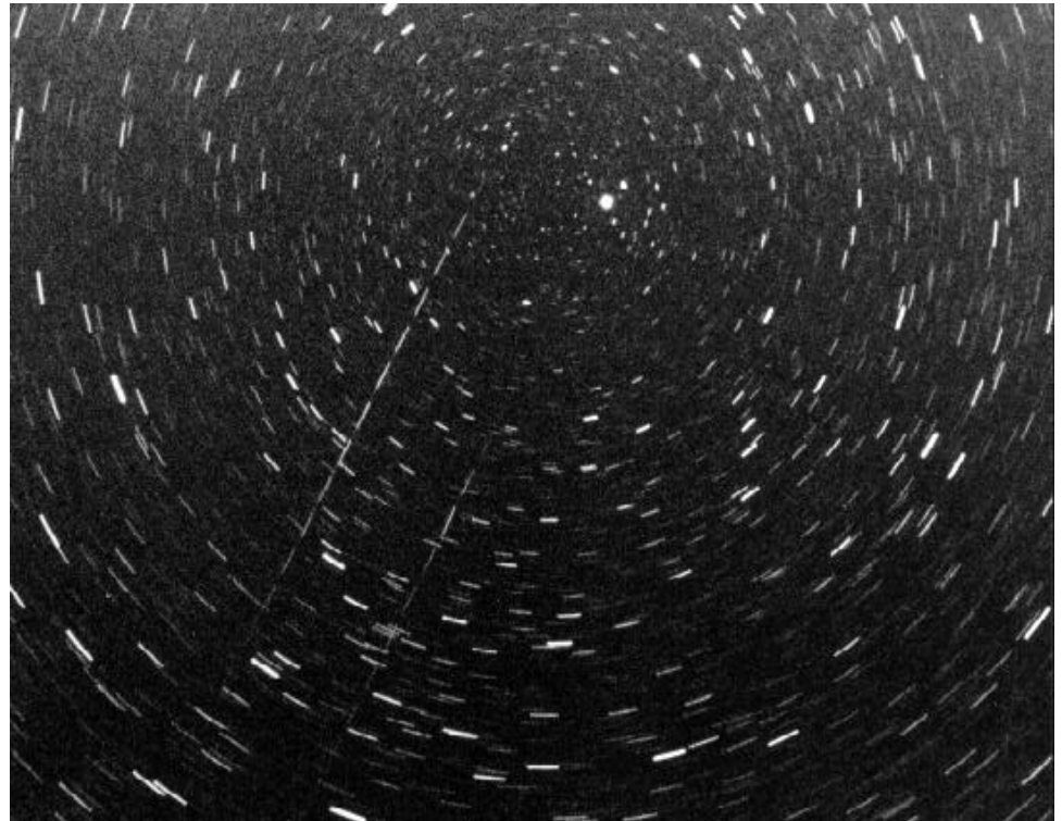
Foto 2 : Twee heldere Leoniden langs de Poolster. Woignarue (F) 17 november 1996. De helderste meteor verscheen om 4h08m57s UT.

Dit was voor team Astra te ver en dus werd een compromis gesloten Team Astra zou noordelijk van de rivier de Somme zitten (oostelijk van Abbevil-