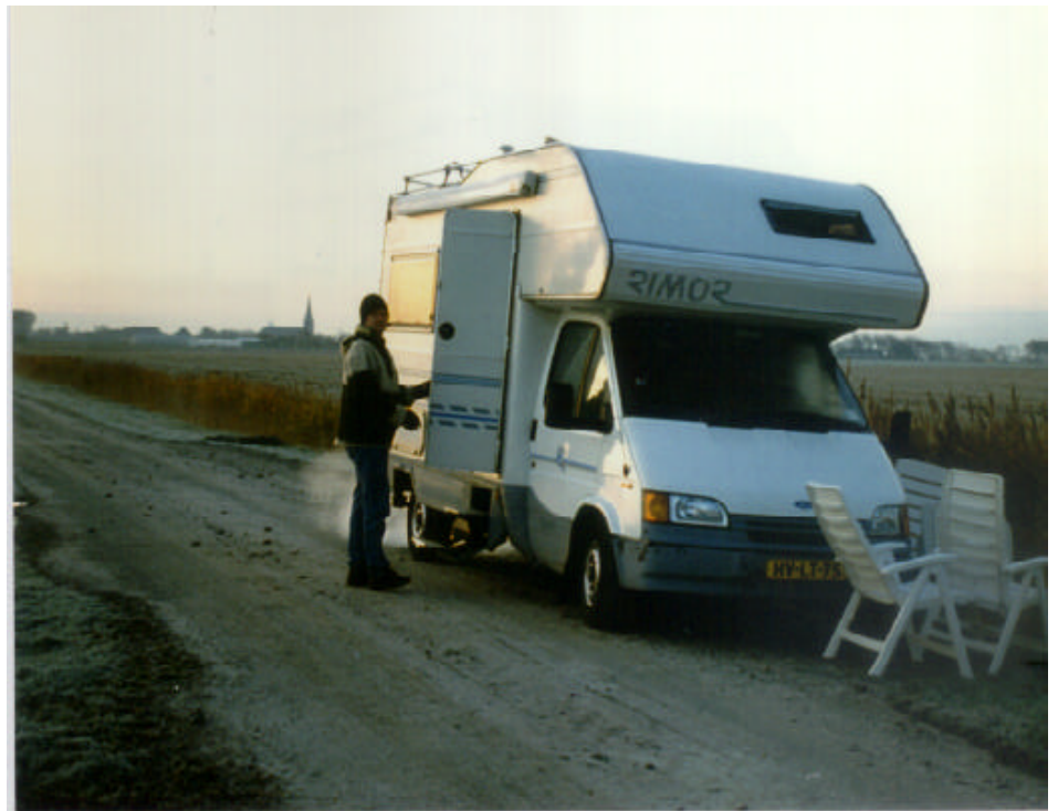
Foto 1 : 1996 was het jaar van de camper. Tijdens de Leonidenactie werd massaal voor dit transportmiddel gekozen. Leonidenactie in Bretagne.