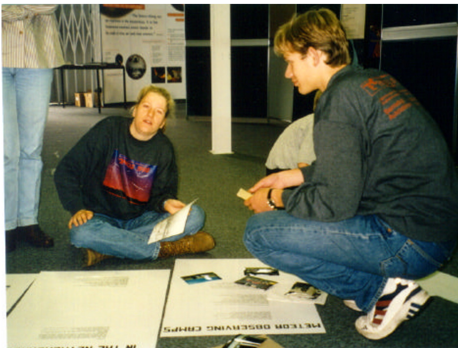
Figuur 1 : De laatste hand wordt gelegd aan de posterpresentatie.

Gelukkig was bijna alles op tijd klaar en konden we op vrijdag 5 juli vertrekken.