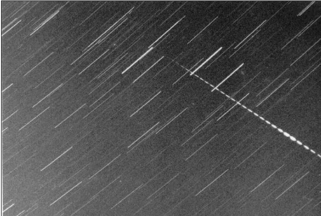
Figuur 5 : 12 Augustus 1996 2h08m40s UT. -4 Perseïde in de Ram. Opname vanuit Bad Nenndorf met Canon FD f/1.8-50 mm