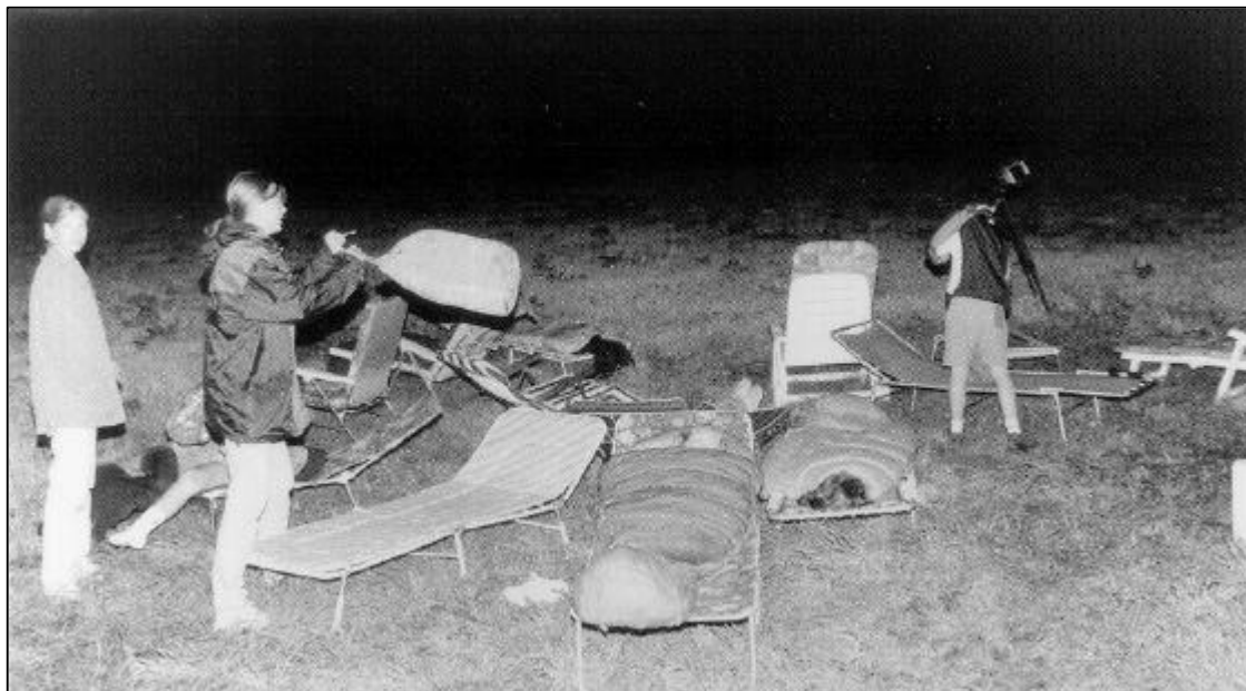
Figuur 2 : Het tijdelijke waarnemingsterrein "Bad Nenndorf" wordt opgezet.

het al duidelijk geworden, dat het een dubbeltje op zijn kant zou worden. Berlijn zat aan de grens van het slecht weer gebied en de Poolse grens zou, met een aantal deelnemers met slechts EU identiteitspapieren en een schat aan kostbare apparatuur aan boord, een absolute blokkade vormen.