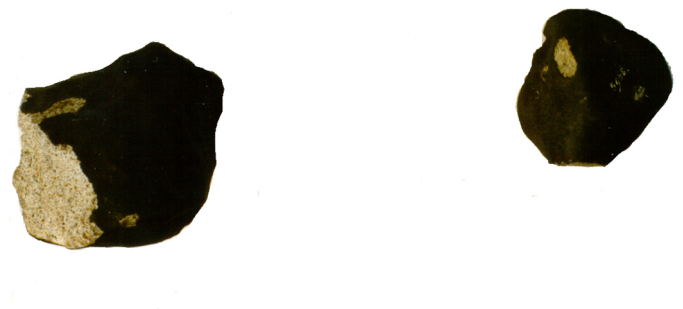
Figure 4: De 'Utrecht' en de 'Uden' bijeen te Bussloo.

Op naar de volgende tien jaar DMS meteoriengeschiedenis!