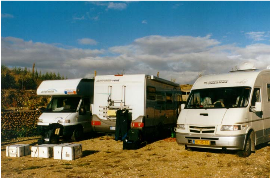
Foto 2 : Een gezellig samenzijn. Drie expeditiecampers bij elkaar in Castellar. Een deel van de apparatuur staat, nog ingepakt, buiten om uitgesplitst te worden.