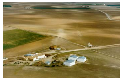
Foto 4 : Luchtopname van post Curica, gemaakt door de MAC. Onze camper in het midden....

De expeditie werd financieel mede mogelijk gemaakt door een bijdrage van het Leidse Kerkhoven Bosschafonds.