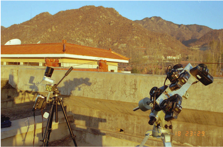
Foto 2 : Geavanceerde techniek te Panshan station: links het videosysteem met objectief en camcorder maar zonder de eigenlijke beeldversterker en rechts de volgmontering voorzien van een tros Canon camera's.