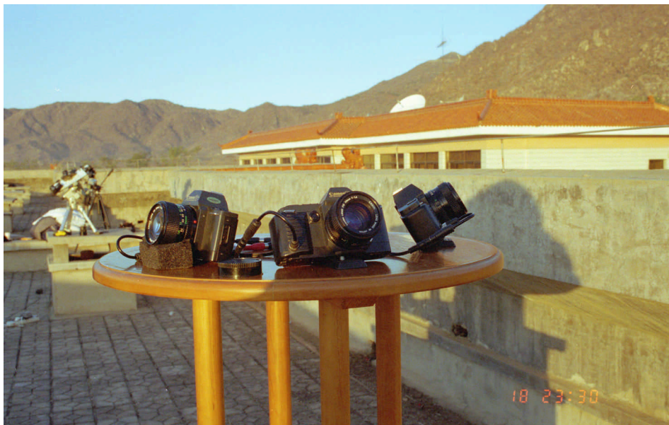
Foto 3 : De inmiddels roemruchte Chinese tafelbatterij waar een aantal Canon's richting horizon staan gepositioneerd.

met studenten aan tafel ergens te Peking voor een op en top Chinese feestmaaltijd. Champagne ! Pan Shan station mag terug kijken op een uniek, meer dan geslaagd Leoniden maximum !