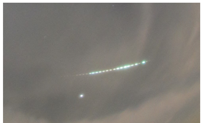
Zuidelijke Tauride vuurbol op 10 november 2022 om 21:01:36. Boven EN900 Woold; midden EN902 Wilderen en onder EN908 Ermelo