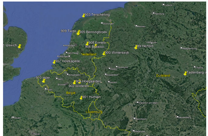
Het west-europese deel van het EN telt inmiddels 13 posten