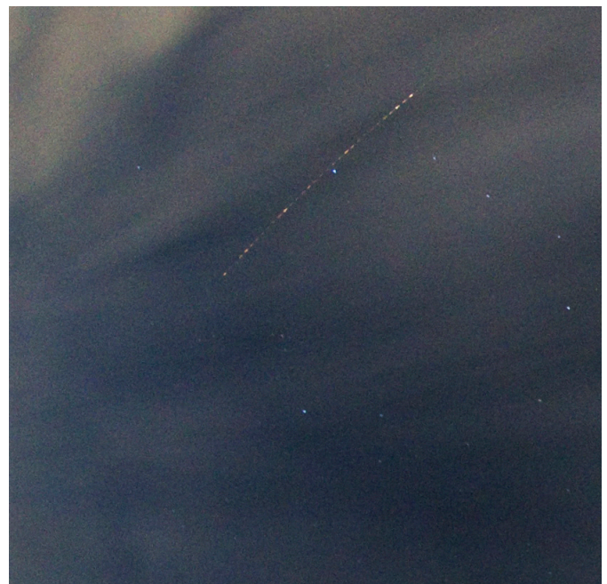
De kop is er af. De vuurbol van 3 januari 2023 1:36:09 gefotografeerd door post EN906 te Bussloo (Volksterrenwacht Bussloo, Mark-Jaap ten Hove en Jaap van 't Leven)